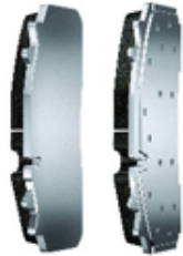
Photo 1 : Plaquette de frein PL standard vs. plaquette de frein technologie Lightweight