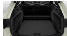
Plancher à deux faces en position basse