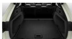
Plancher réversible (résine sur le dessus)