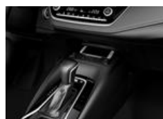
Compartiment de console avant avec chargeur sans fil (GLX)