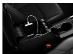
Casier de console centrale