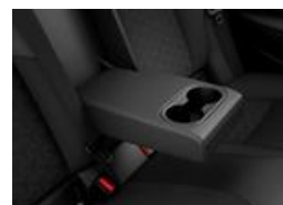
Accoudoir central arrière

Toute une série de rangements des plus pratiques sont disséminés dans tout l'habitacle, offrant tout l'espace nécessaire pour placer de petits objets tels que les téléphones et les boissons, tant au niveau de la première que de la deuxième rangée de sièges.