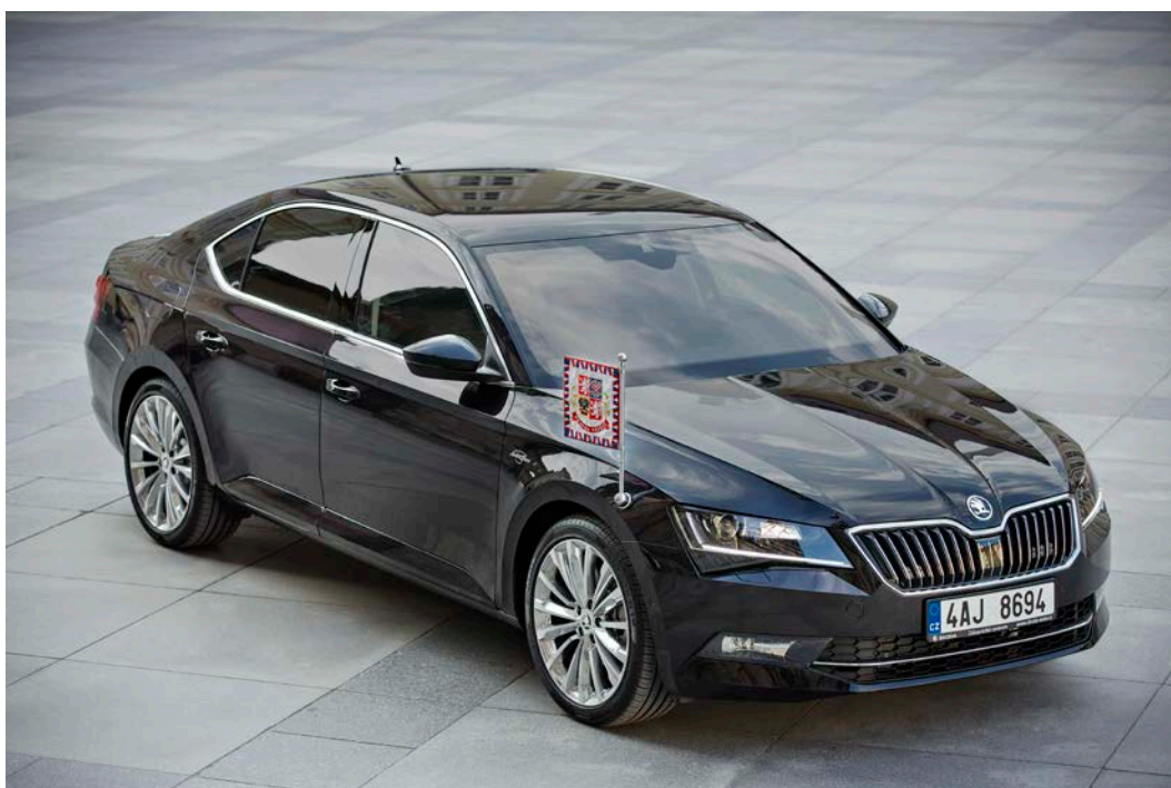
ŠKODA Superb du Président de la République tchèque