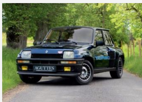
1982 – Renault 5 Turbo Adjugée 96 120 € TTC