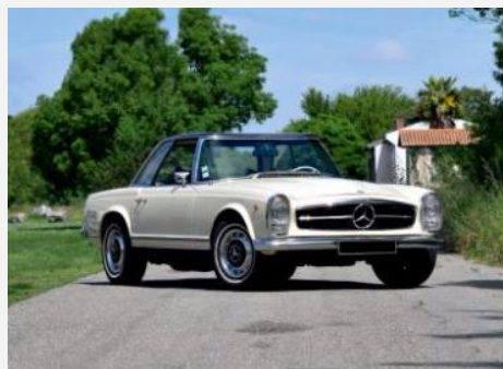
1969 – Mercedes 280SL Pagode Adjugée 90 120 € TTC