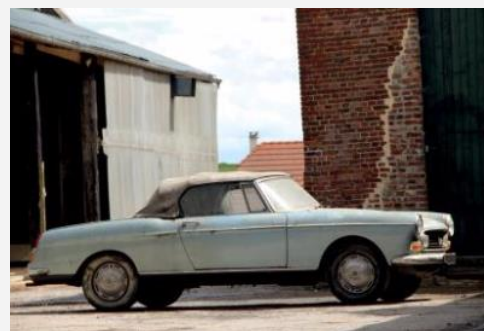
1967 - Peugeot 404 Cabriolet Injection Adjugée 38 520 € TTC