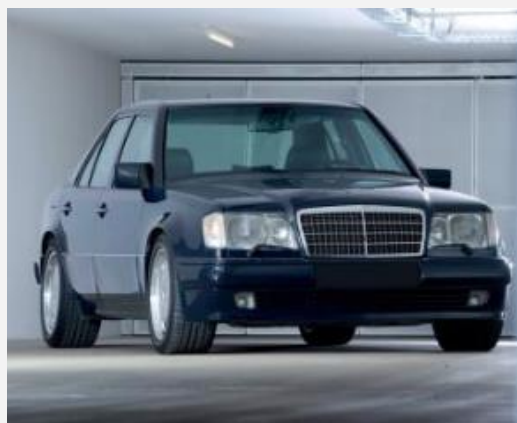
1993 – Mercedes-Benz E60 AMG Adjugée 138 120 € TTC