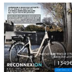
Vélo PEUGEOT eC03