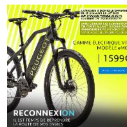
Vélo PEUGEOT eM03