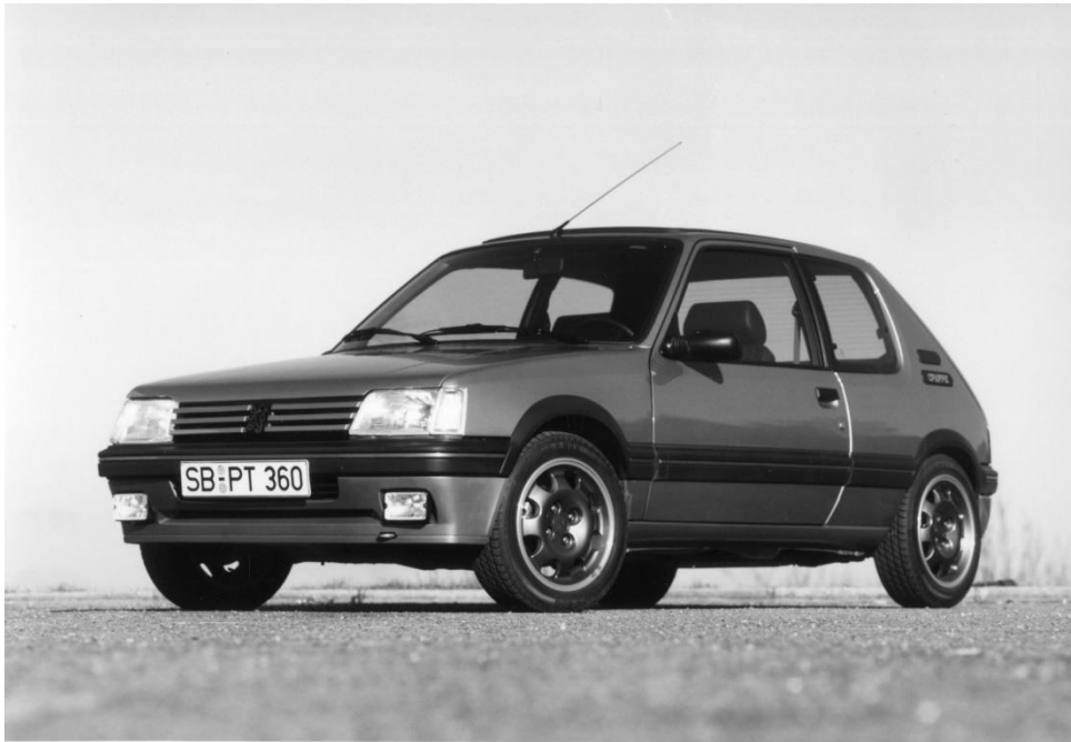
PEUGEOT 205 GRIFFE

En 2023, la PEUGEOT 205 fête son 40e anniversaire !