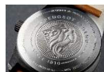
Boîtier gravé PEUGEOT LEGEND