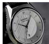
Boîtier en acier brossé, cadran gris lamellé