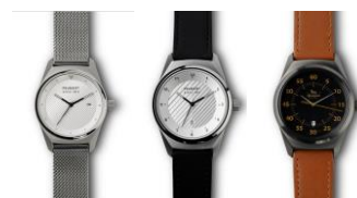
Montres « Armand SINCE 1810 »