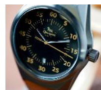
Boîtier en acier « Antic Silver »