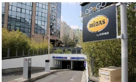
Entrée du parking Indigo Place Abel Gance

Ce parking de Boulogne n'a par ailleurs pas été choisi par hasard puisqu'il est en effet implanté dans un quartier d'affaires stratégique . Sur trois niveaux, il propose un total de 525 places (dont près de 400 abonnés) et abrite pour 75% des voitures de société. De grandes entreprises telles que TF1, Canal+ ou encore France Galop sont situées juste au dessus de celui-ci et mettent de nombreuses voitures à disposition de leurs collaborateurs. Autant d'opportunités de fidélisation à ce service innovant et gage d'utilité pour les utilisateurs Indigo .