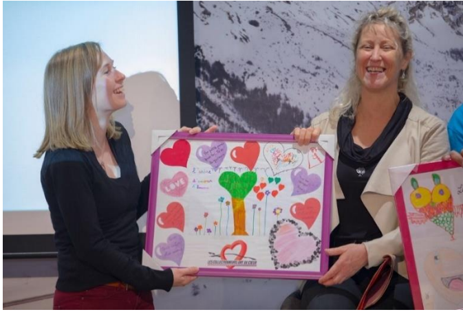
L'association des enfants