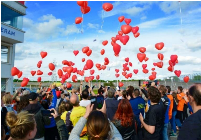
Rdv automobile à Montlhéry