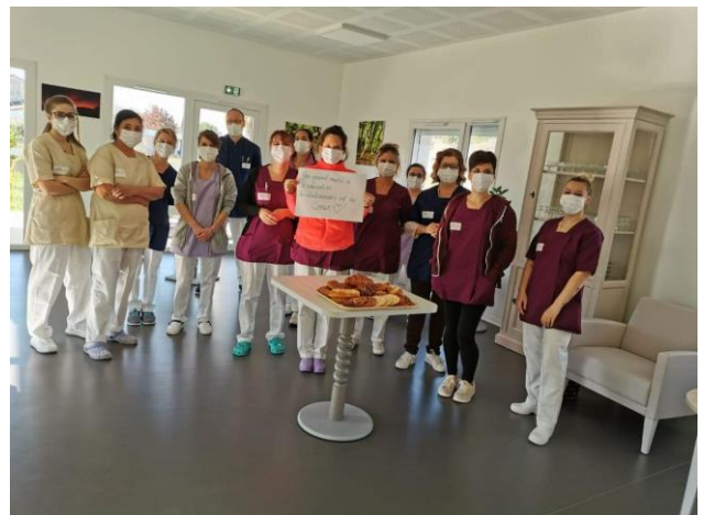
Des équipes médicales engagées