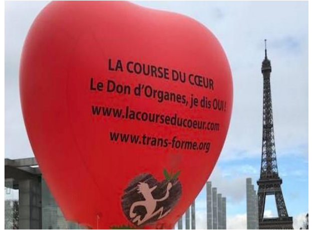
La course du Cœur