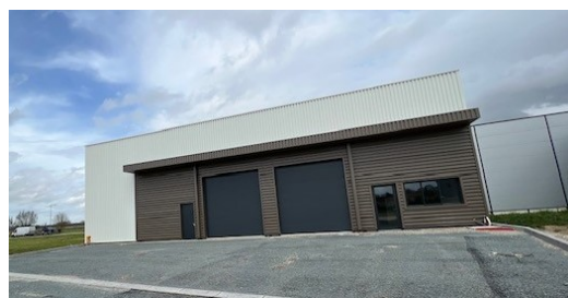
Nouveau Service HYDROPARTS Assistance développé par le franchisé HPA 17 – Un atelier « fixe » pour les gros travaux