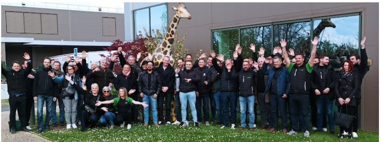
Réseau HYDROPARTS Assistance, séminaire Avril 2022

HYDROPARTS Assistance, 1 er réseau organisé en France de contrôle*, maintenance et dépannage de hayons élévateurs sur véhicules professionnels (7/7 - 24/24), s'est réuni pour sa convention annuelle à Nanterre, au siège de la franchise les 3 et 4 avril. Une première en physique depuis 2019 ! 100% des 28 franchisés ont répondu présent à ce rdv mixant travail et événement. Fil rouge de ces deux jours – "Avancer Ensemble" pour un objectif réaffirmé d'une couverture de 100% du territoire national par le service HYDROPARTS Assistance en 2025.