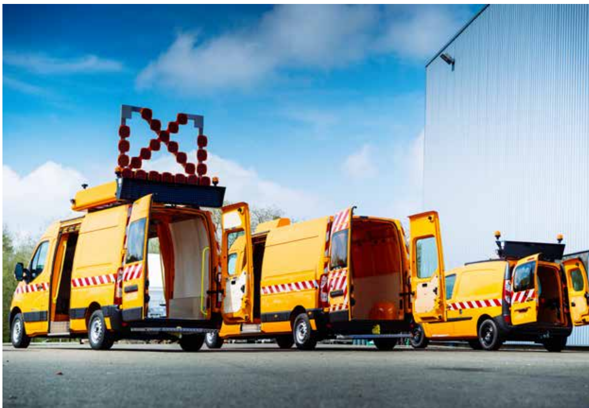
Des patrouilleurs Gruau hyper équipés pour une grande sécurité des Hommes au travail. Gruau le Mans est l'un des rares sites du Groupe avec Labbé à transformer des véhicules industriels.