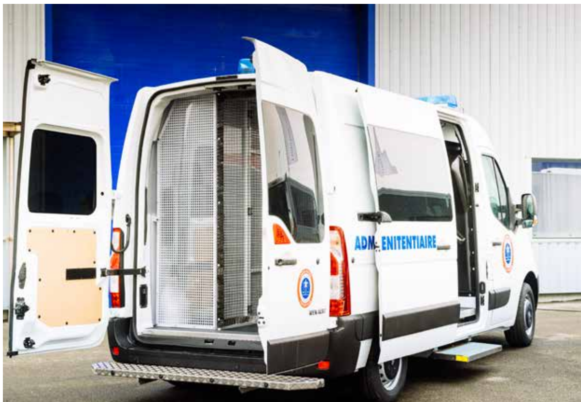
Véhicules de transfèrement de détenus. Visites régulières de clients au coeur de l'atelier pour plus de proximité avec les équipes-terrain.