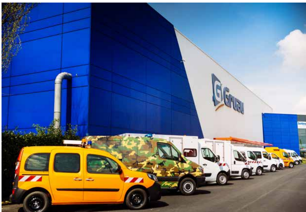
Gruau Le Mans, une large gamme de Véhicules BTP et Spécifiques sur bases VU et VI.