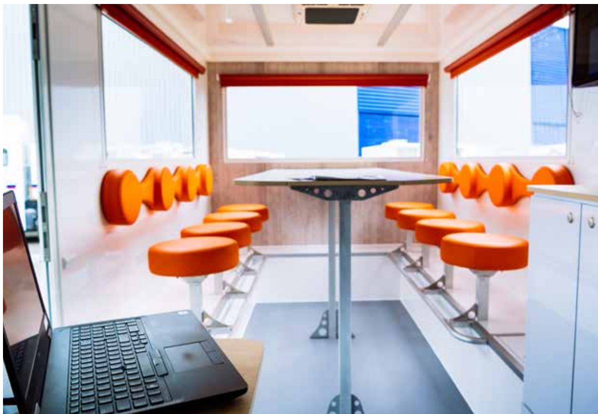
Rendre tous les métiers mobiles pour plus de liberté : intérieur de bureau mobile. Rendre tous les métiers mobiles pour plus de liberté : intérieur de véhicules magasin.