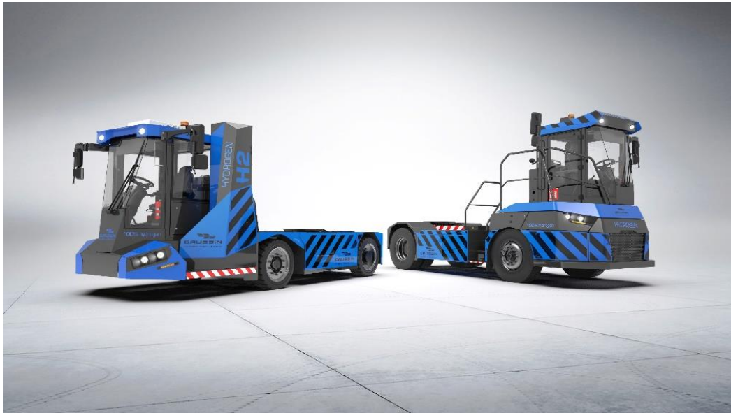
L'ATM-H2 et l'APM-H2, nouveaux fers de lance de la gamme de véhicules GAUSSIN

Enfin, cette technologie ouvre la voie à d'autres innovations pour l'avenir. L'hydrogène est non seulement un acteur majeur pour l'avenir du transport de charges lourdes mais aussi un vecteur énergétique important dans l'avènement des énergies solaires et éoliennes. Avec l'hydrogène, il devrait être possible de lisser la production de ces énergies propres et de mieux les intégrer aux réseaux de distribution électrique.