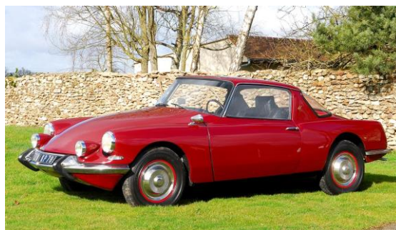
DS Coupé Bossaert GT 19

Organisée avec le précieux soutien de l'Amicale CITROËN France* et celui des clubs DS et SM**, l'exposition réunira cinq modèles de prestige ainsi que la dernière création de la Marque, Nouvelle DS 3. Raffinement et technologie sont au programme de cette deuxième participation.