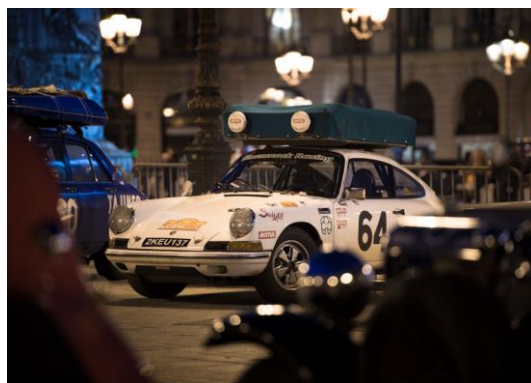
Photo gagnante du calendrier Glasurit 2014

Florent Mahiette, photographe professionnel, il avait remporté le concours dès sa première participation, en 2014 !