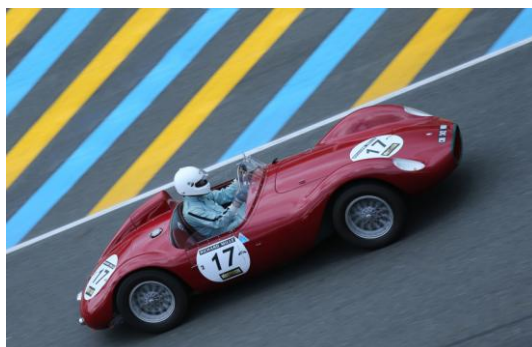
Photo gagnante du calendrier Glasurit 2015

Stéphane Horber, passionné de voitures et de motos, qui a toujours le don de mettre en valeur les détails des objets qu'il photographie.