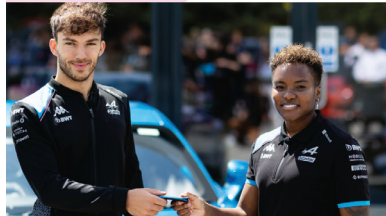
Prise d'acte en compagnie de l'Alpine Academy.

Damon Hill, qui aura également fourni les pneus du moteur à se hisser sur le grêle de départ en raison d'un problème plus que limité. Il faudra ensuite patienter 22 longues années avant de revoir une femme au volant lors d'un week-end de Formule 1. Rejoindre par Williams en qualité de pilote de développement en 2012, Susie Wolff est alignée durant les Escalis Libres 1 des Grands Prix de Grande-Bretagne puis d'Allemagne 2014. L'occasion renouvelée l'expérience la saison suivante à Barcelone (Espagne) et Silverstone (Royaume-Uni). L'ancienne coureuse DTM devient ensuite technicienne, puis CEO de Racecar Media en Formule E avant d'être nommée, le 1 er mars 2023, directrice générale du nouveau championnat de monoplace 100% féminin affilié à la catégorie reine : la F1 Academy.