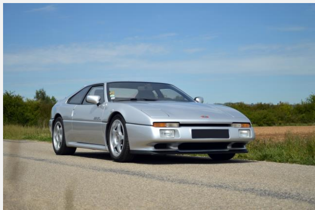
1996 – Venturi 260 LM Estimation : 50 000 – 60 000 €