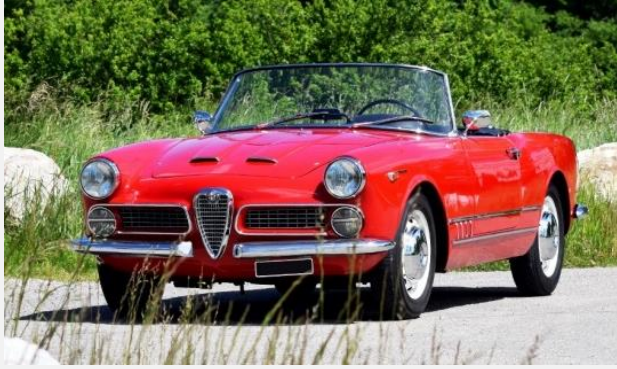
1960 – Alfa Romeo 2000 Spider Touring Estimation : 50 000 - 70 000 €