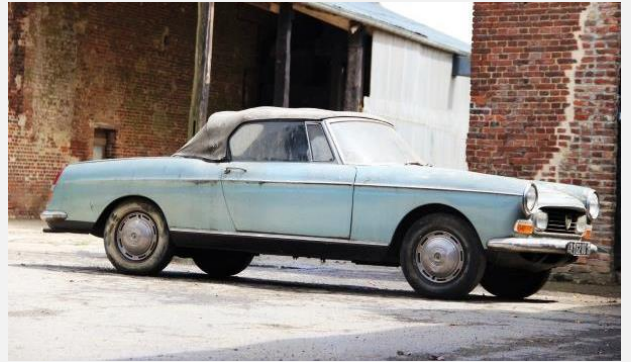
1967 – Peugeot 404 Cabriolet Injection Estimation : 10 000 - 15 000 €

Présentée au Salon de Paris en 1961, la Peugeot 404 Cabriolet préfigure le renouveau stylistique de la marque avec une carrosserie élégante signée Pininfarina qui inscrit ce modèle parmi les plus belles voitures françaises des années 60. Notre modèle "sorti de grange", stocké dans un garage privé des Hauts de Seine depuis trente-trois ans, appartient à la 2ème série produite à partir de juin 1966. Cette version recherchée est complète et dans un état de conservation parfaitement sain. Il s'agit d'une occasion unique à un prix défiant toute concurrence sur un marché où la cote de ce modèle est beaucoup plus élevée.