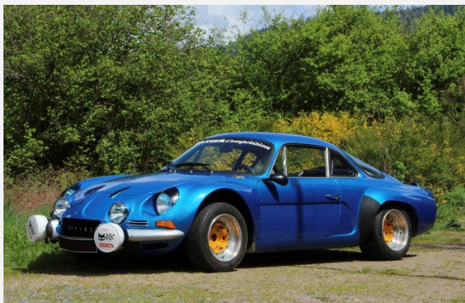
1970 – Alpine A110 1600 S Gr. IV - Ex Jean Saurel Estimation : 100 000 – 120 000 €

Enfin, grande classique recherchée par les amateurs d'américaines, une rare Chevrolet Corvette C1 de 1964 (3 640 exemplaires assemblés cette année-là) figure à notre catalogue.