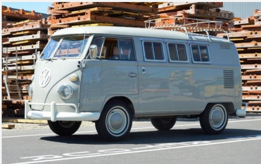
1965 - Volkswagen Combi T1 Camper Estimation : 55 000 - 75 000 €

Dès 14h30, affiches (consacrées pour la plupart au Grand Prix de Monaco et au Rallye Monte-Carlo), livres, catalogues, photographies, lithographies, documentations, miniatures, voiture (échelle 1/2), ou encore mascottes et trophées cristalliseront les premières enchères de l'après-midi. Puis, à partir de 18 heures, les véhicules de collection joueront les premiers rôles de notre Vente d'Eté.