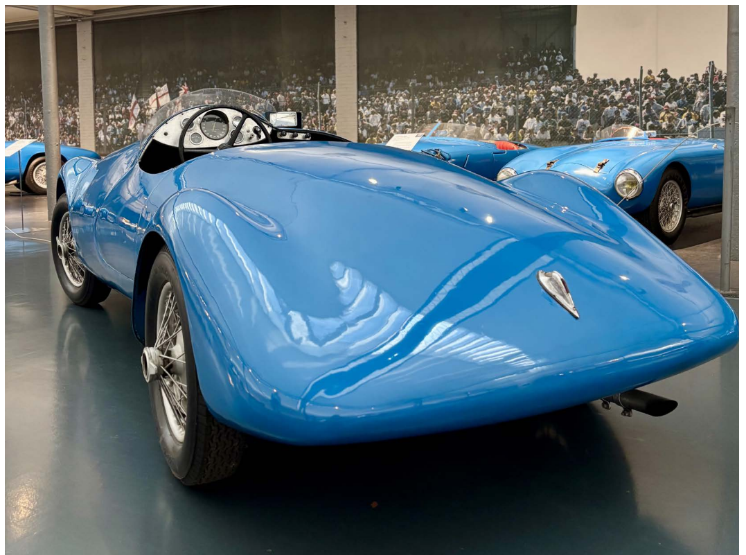
Gordini Simca 8 de 1939

À noter : le Grand Prix Auto a été présenté lors de l'avant-première du Salon Rétromobile le mardi 27 janvier et le sera durant toute la durée du salon sur le stand de la Fédération Française des Véhicules d'Époque (Bâtiment 7.2, stand C083).