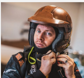
Guerlain CHICHERIT Vainqueur de la Coupe du Monde de rallye-raid en 2009

Pour d'autres, comme Guerlain CHICHERIT, Sébastien LOEB et les 3 régionaux de l'étape, Nathanaël BERTHON, Christian SARRON et Rudy SERVOL, le Charade Super Show sera l'occasion de découvrir la boucle de 8,055 km, variante historique du circuit actuel de 3,975 km qu'ils connaissent déjà.