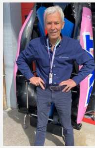
Philippe ALLIOT 9 saisons en Grand Prix de Formule 1