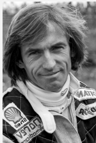
Jacques LAFFITE 176 participations en Grands Prix de Formule 1, dont 6 victoires