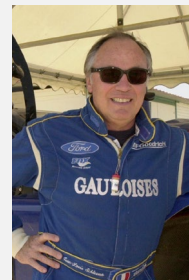
Jean-Louis SCHLESSER 2 victoires au Paris-Dakar et 7 titres mondiaux (rallyes-raids et endurance)