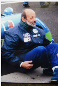
Henri PESCAROLO Record de 33 participations aux 24 Heures du Mans, dont 4 victoires

Ce sera un moment magique, empli d'émotions, pour les pilotes qui courraient avec bravoure dans différentes catégories sur le « grand » tracé originel jusqu'à la fin des années 1980. Charade retrouvera ainsi sa grandeur d'antan et certains des pilotes qui ont fait sa renommée comme Giacomo AGOSTINI, Philippe ALLIOT, Yannick DALMAS, Jacky ICKX, Jacques LAFFITE, Henri PESCAROLO ou encore Jean Louis SCHLESSER.