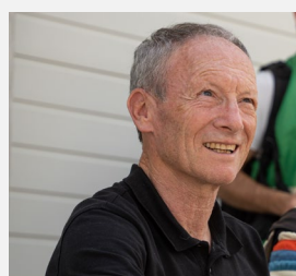
Christian SARRON 7 victoires en Moto GP, champion du monde 250 cc en 1984