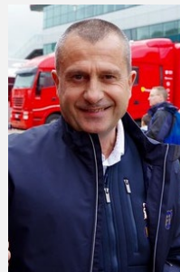
Yannick DALMAS 4 victoires aux 24 Heures du Mans

Ayant tous connu le « grand » circuit de Charade, ces pilotes lui vouent aujourd'hui encore un attachement particulier, à l'image d'Henri PESCAROLO qui en 2018 déclarait au quotidien l'Équipe :