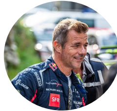
Sébastien LOEB invité d'honneur