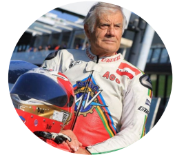
Giacomo AGOSTINI invité d'honneur

Nous dévoilons aujourd'hui la liste des autres pilotes d'exception qui seront présents à l'occasion du Charade Super Show.