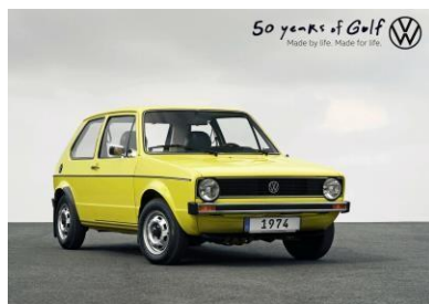
Modèle au cœur de la marque Volkswagen : la Golf fête ses 50 ans

La Golf est le cœur de la marque Volkswagen. Modèle emblématique, la Golf peut se prévaloir d'une destinée commerciale hors du commun : plus de 37 millions d'exemplaires vendus en huit générations. Volkswagen célèbre l'année prochaine le 50 e anniversaire de ce modèle au formidable succès auprès du public. La Golf a façonné la mobilité en Allemagne, mais aussi dans de nombreuses autres régions du monde. Pour célébrer ce cinquantenaire, Volkswagen ne se contente pas de regarder en arrière : la nouvelle Golf fera sa première mondiale dès la fin du mois de janvier. Comme ses prédécesseurs, elle apportera de nombreuses innovations dans la production en série.