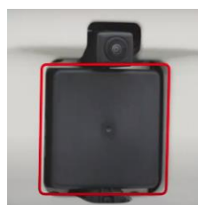
Radar à ondes