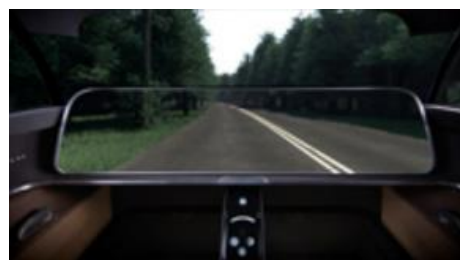
Technologie de camouflage optique (représentation)