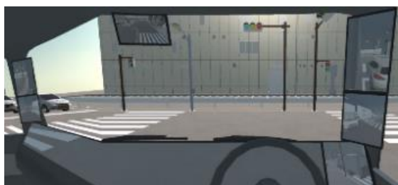
Système d'expansion de la visibilité lors de la conduite (représentation)

Réduit les angles morts en rendant les tableaux de bord et les piliers transparents.