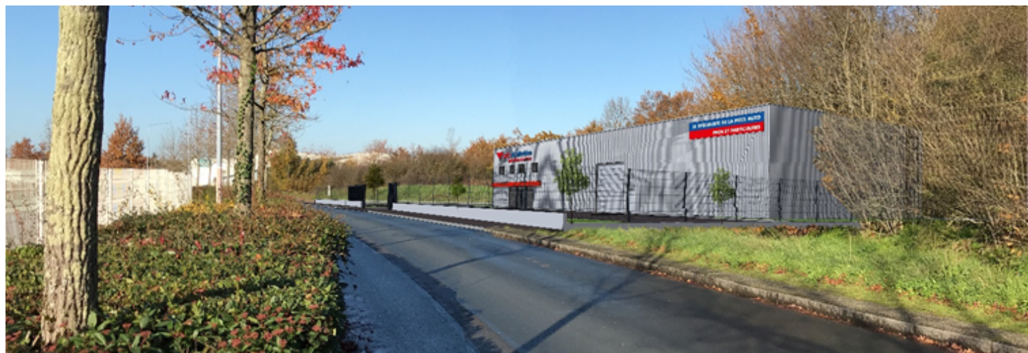
Visuel projection agence CARQUEFOU

Autodistribution AUTO PIÈCES ATLANTIQUE ouvre une nouvelle agence à CARQUEFOU (44)