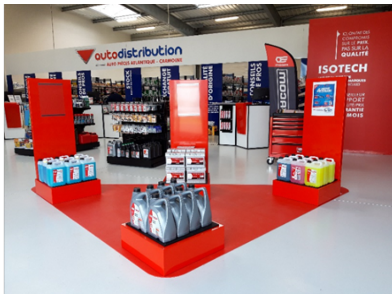
Aménagement intérieur nouvelle charte Autodistribution

A ce jour, les plateformes de Nantes et Rennes d'une superficie totale de 13.500 m 2 permettent aux clients professionnels d'APA d'avoir accès au stock de pièces de rechange multimarques le plus important du Grand-Ouest, complétées pour le dépannage par 14 sites de proximité (dont 11 sont équipés d'un Atelier Technique), sur les départements de la Loire Atlantique (44), de l'Ille-et-Vilaine (35) ainsi qu'une partie du Maine-et-Loire (49) sans oublier une logistique clients pouvant être optimisée jusqu'à 4 livraisons par jour. Enfin ce sont plus de 350 collaborateurs qui œuvrent au quotidien avec l'objectif de satisfaire une clientèle passionnée et exigeante.