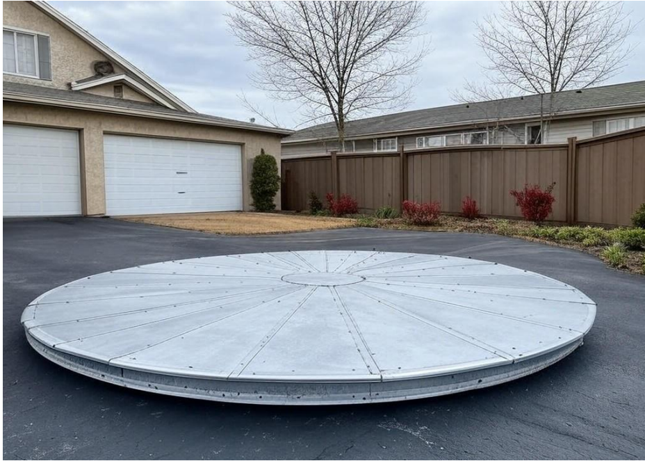
Plateau tournant avant habillage. [/caption]