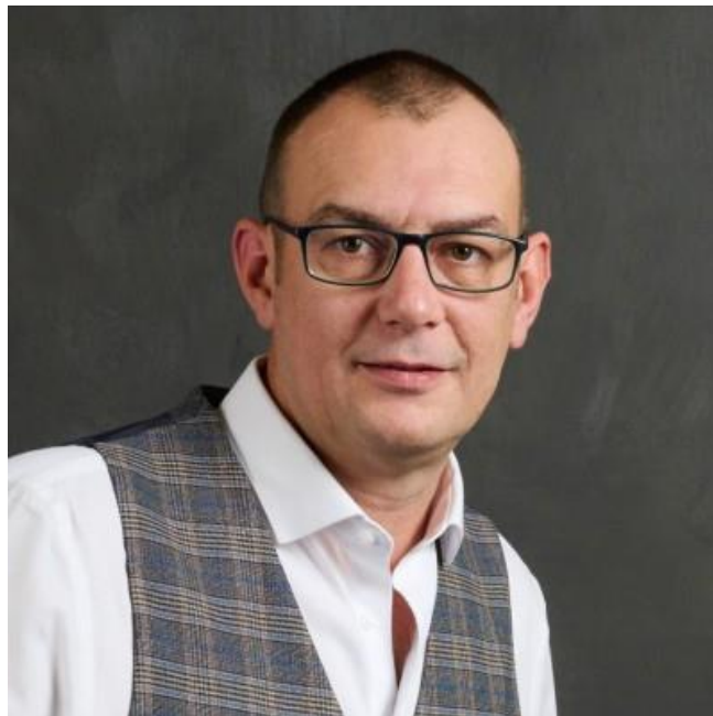
Arnaud Roy, fondateur de Saturne Drive. [/caption]

Avec Saturne Drive, il met aujourd'hui ce savoir-faire industriel au service de la valorisation automobile à travers des solutions premium conçues et fabriquées en France .