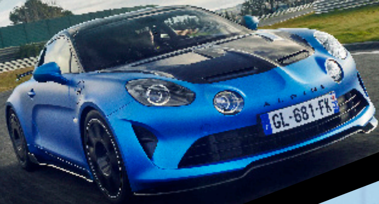
Alpine A110 R