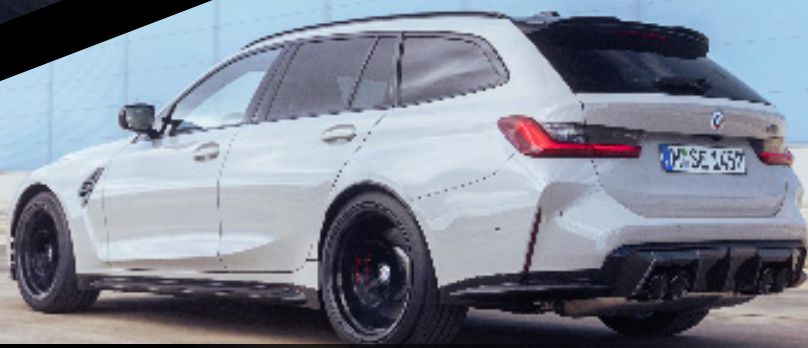
BMW M3 Compétition M xDrive Touring