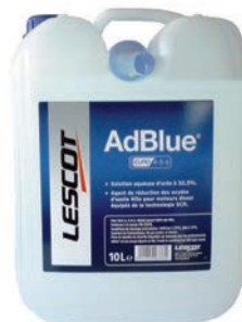
Bidon AdBlue - 10 L Réf. : Lescot 105193