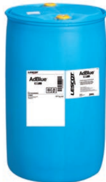
Fût AdBlue - 208 L Réf. : Lescot 105194