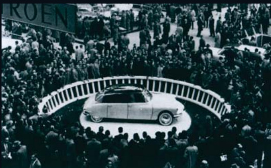
L'étoile du Salon 1955 tourne lentement sur son stand, indifférente à l'agitation alentour.