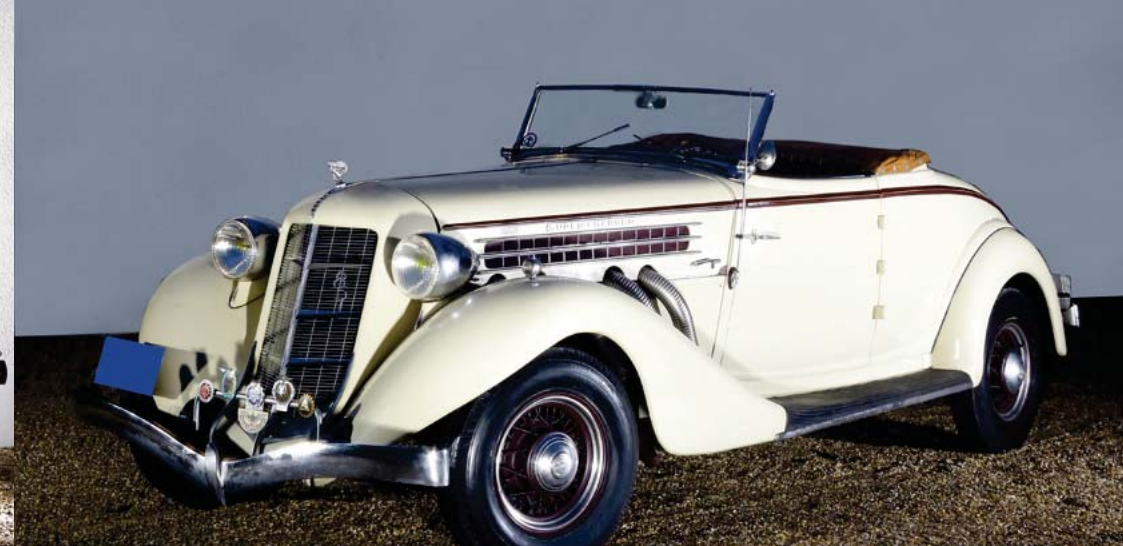
Automobiles de collection de M.COCHEUX