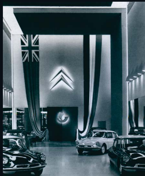
Fin 1956, DS et ID dans le salon d'exposition de Citroën sur les Champs-Élysées. Les drapeaux rappellent la visite de la Reine d'Angleterre.

Jacques Wolgensinger, livre de Olivier de Serres "DS le grand livre" éditions EPA