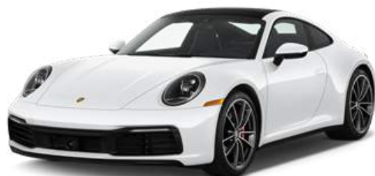
Porsche 911, 2021