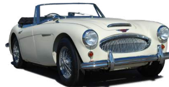
Austin Healey Roadster, 1981