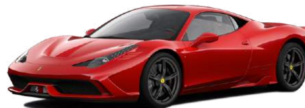
Ferrari 458, 2013