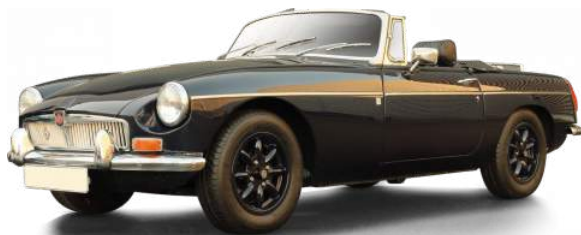
MG B, 1972

Notre solution d'assurance est économique parce qu'elle est intelligente grâce à cette méthode de paiement à l'usage. A titre d'exemple, le prix moyen quotidien pour un véhicule d'une valeur de 70000€ est de 390€ / an au garage plus 10€/ jour d'utilisation.