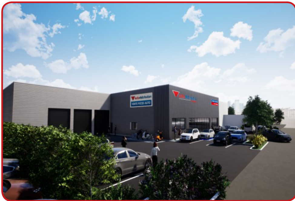
Nouvelle agence de Cesson-Sévigné accueillant l'atelier de rectification