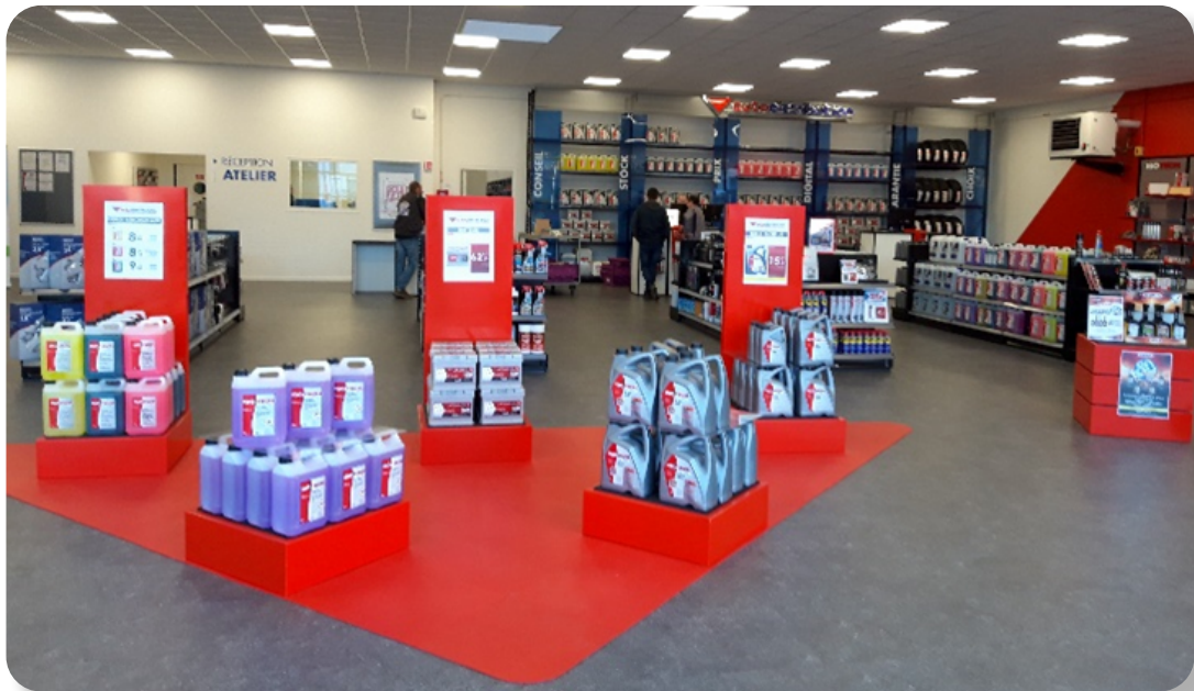
Aménagement intérieur nouvelle norme Autodistribution