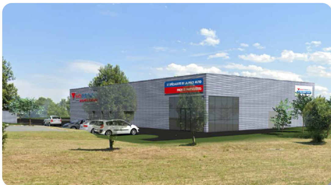
Visuel projection agence ANCENIS

Ce site vient compléter le dispositif déjà existant d'APA, avec un total de 2 plateformes lui permettant d'avoir accès au stock de pièces de rechange multimarques le plus important du Grand-Ouest, et 13 sites de proximité (dont 10 sont équipés d'un Atelier Technique), sur les départements de la Loire Atlantique (44), de l'Ille-et-Vilaine (35) ainsi qu'une partie du Maine-et-Loire (49) sans oublier une logistique clients pouvant être optimisée jusqu'à 4 livraisons par jour. Enfin ce sont plus de 330 collaborateurs qui œuvrent au quotidien avec l'objectif de satisfaire une clientèle passionnée et exigeante.