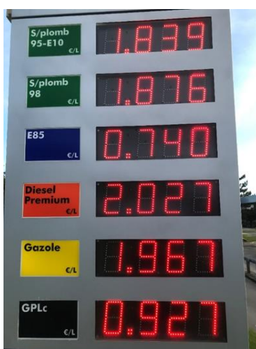
Photo de totem de stations-service le 15/3/2026

Evolution du nombre de vues de la page Facebook de la Communauté Superéthanol-E85 depuis le 27/2/2026