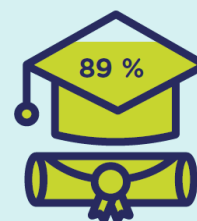
TAUX DE RÉUSSITE DES SORTANTS 2019