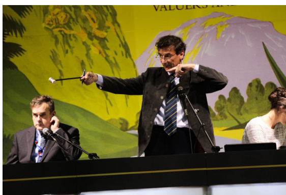
MAÎTRE COUTAU-BÉGARIE