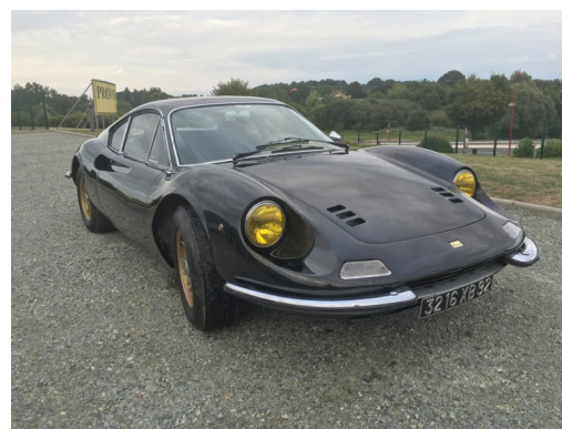
FERRARI 1969 | 246 GT «DINO» TYPE L | 310 000€