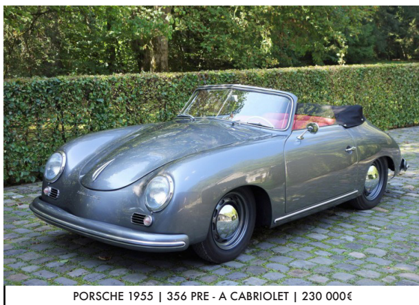
PORSCHE 1955 | 356 PRE - A CABRIOLET | 230 000€