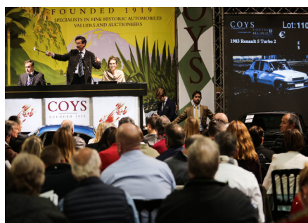
COYS | MONDIAL DE L'AUTOMOBILE

A TITRE EXCEPTIONNEL, TOUS LES VÉHICULES DE COLLECTION DE CETTE VENTE AUX ENCHÈRES RESTERONT VISIBLES AU MONDIAL DE L'AUTOMOBILE JUSQU'AU 16 OCTOBRE 2016