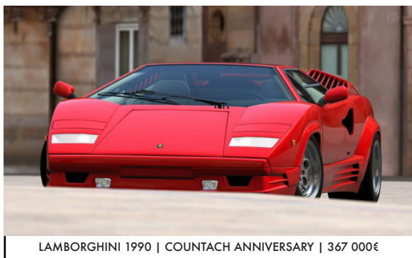
LAMBORGHINI 1990 | COUNTACH ANNIVERSARY | 367 000€