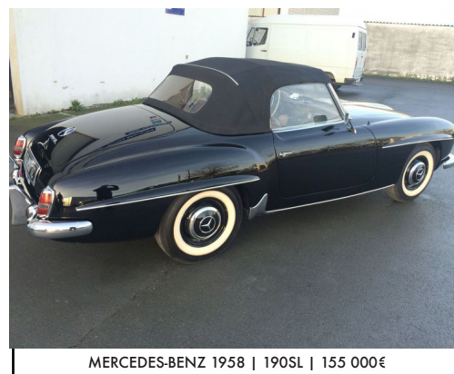
MERCEDES-BENZ 1958 | 190SL | 155 000€