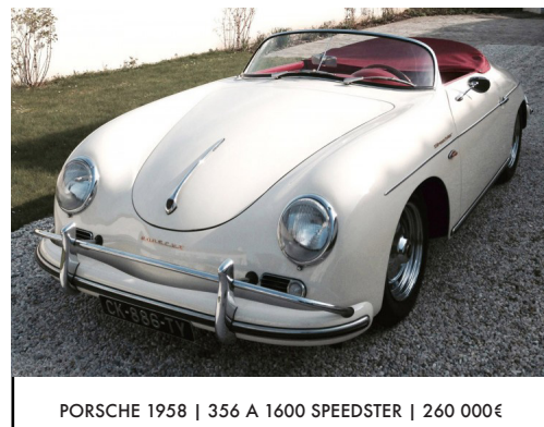
PORSCHE 1958 | 356 A 1600 SPEEDSTER | 260 000€