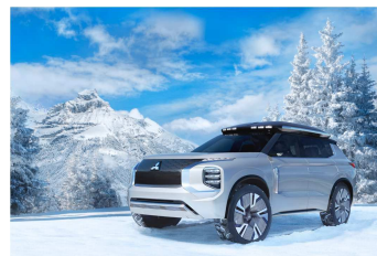
「MITSUBISHI ENGELBERG TOURER」