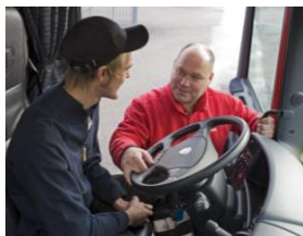
Formation conducteur Conduite pour un bon rendement énergétique