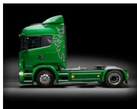
Véhicule Spécification optimisée en CO 2 et en énergie