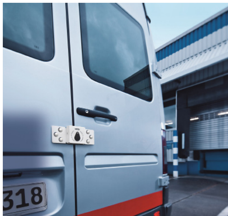
DI 142/200 pour portes coulissantes