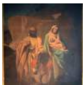
CHER ② Fuite en Egypte Conservée à Bourges (18)