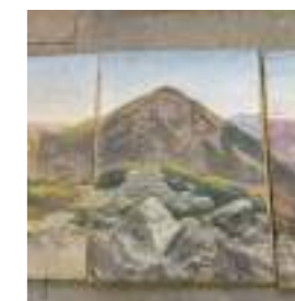
PUY-DE-DÔME ⑨ Panorama de Montagne Conservé à Issoire (63)