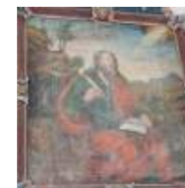
VOSGES ⑬ saint Marc Conservé à La Croix-aux-Mines (88)