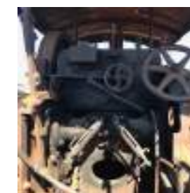
SAÔNE-ET-LOIRE ⑫ Cylindre Aillot Conservé à Montceau-les-Mines (71)