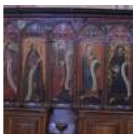
LOIRE ④ Stalles Conservées à Charlieu (42)