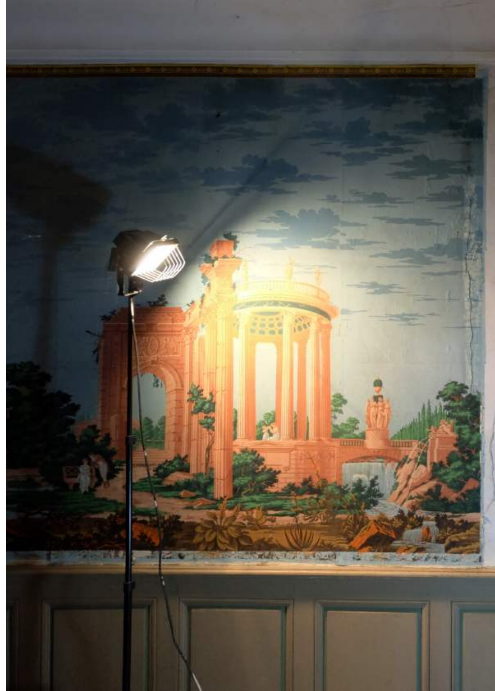
Les Ruines de Rome , papier peint panoramique du XIXème siècle repéré par les salariés du site de Blavozy et restauré en 2019. →