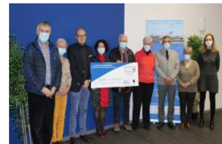
↑ Remise de prix en juin 2021 à la commune de Sancerre (Cher) pour la restauration de la toile Le Décalogue .