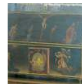
PUY-DE-DÔME ⑩ Chasse de saint Austremoine Conservée à Mozac (63)