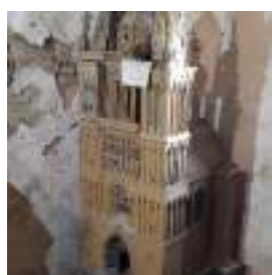
MAINE-ET-LOIRE ⑥ Maquette Conservée à Louvaines (49)