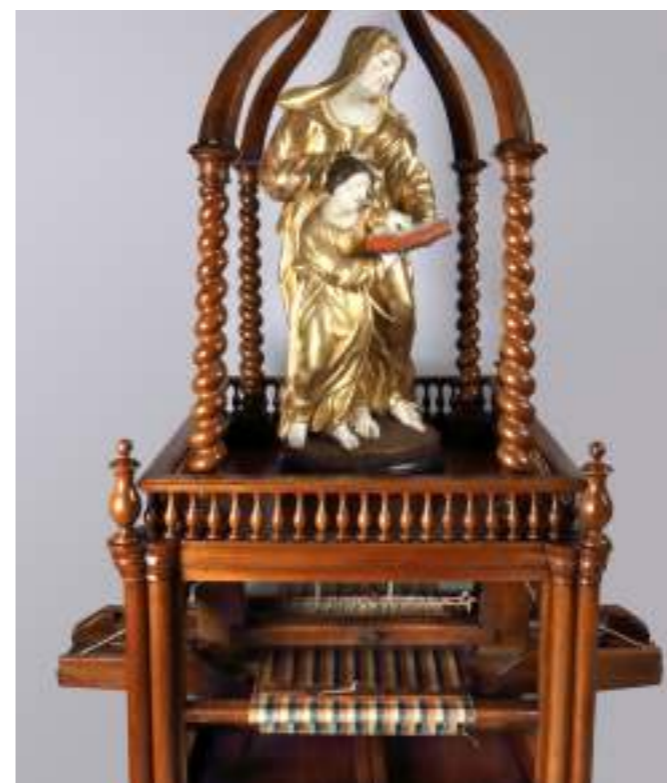
↑ Groupe sculpté de sainte Anne sélectionné par le site de Roanne en 2018, après restauration. Sainte Anne est la patronne des tisserands, elle joue un rôle important dans la tradition textile et industrielle de la ville.

Lancée en 2013, cette initiative vise à ce que les citoyens s'emparent de la problématique de la restauration du patrimoine mobilier de nos communes. Elle vise à restaurer des œuvres d'art accessibles à tous gratuitement (places publiques, églises, mairies, musées gratuits). Le Plus Grand Musée de France s'appuie dans un premier temps sur des étudiants. Ils sont invités à sélectionner des objets (tableaux, sculptures, peintures, patrimoines industriels et scientifiques) avant de lever des fonds auprès des entreprises et des particuliers pour permettre leur restauration. Devant le succès de cette campagne, deux déclinaisons sont créées : pour les entreprises en 2014 avec Michelin, puis pour les lycéens en 2018.