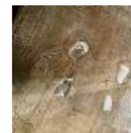
SEINE ⑭ Dalle funéraire Conservée à Paris (75)