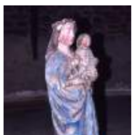
MORBIHAN ⑦ Vierge à l'enfant Conservée à Theix (56)