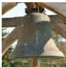
AUBE ① Cloche Conservée à Assencières (10)