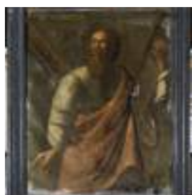
GIRONDE ③ Apostolado Conservé à La Brède (33)