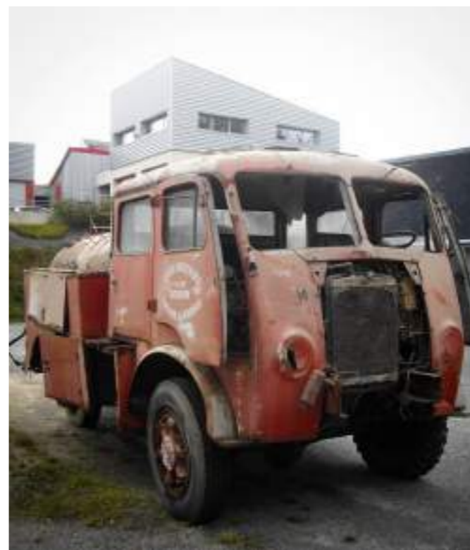
↑ Camion de pompier Berliet de 1956, sélectionné par le site de Vannes en 2021. ©Association ADSVAR