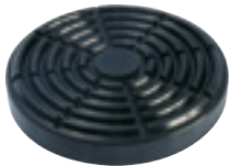
EG 1135 | 11 €HT* TAMPON CAOUTCHOUC ROND Ø160x28mm