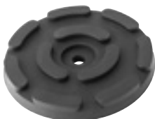
EG 1142 | 11 €HT* TAMPON CAOUTCHOUC ROND Ø143x25mm