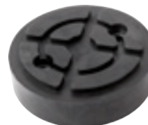
EG 1146 | 12 €HT* TAMPON CAOUTCHOUC ROND Ø120x32mm