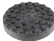
EG 1144 | 11 €HT* TAMPON CAOUTCHOUC ROND Ø147x26mm