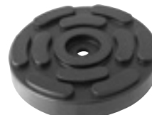
EG 1145 | 11 €HT* TAMPON CAOUTCHOUC ROND Ø140x27mm