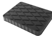
EG 1138 | 13 €HT* TAMPON CAOUTCHOUC RECTANGULAIRE 160x120x20mm