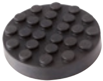
EG 1139 | 11 €HT* TAMPON CAOUTCHOUC ROND Ø120x26mm