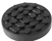
EG 1141 | 11 €HT* TAMPON CAOUTCHOUC ROND Ø124x26mm