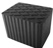
EG 1143 | 33 €HT* TAMPON CAOUTCHOUC RECTANGULAIRE 160x120x115mm