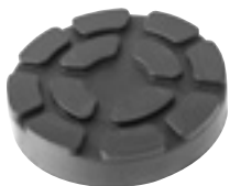
EG 1140 | 11 €HT* TAMPON CAOUTCHOUC ROND Ø98x21mm