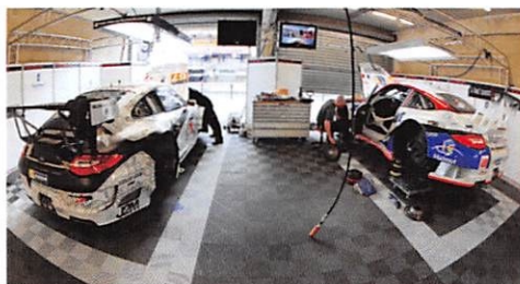
Résistance extrême: hydrocarbures, crics, chandelles