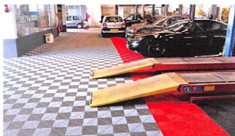
Atelier Mécanique : matériau non poreux, pas de taches