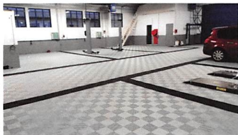
Atelier Carrosserie : élimine 80% de la poussière au sol.