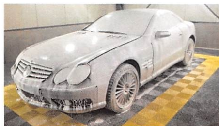
Dalles drainantes pour zones de lavage