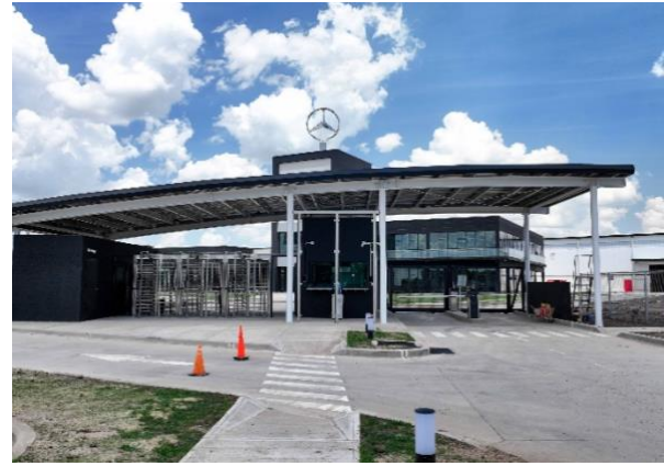
Entrance Zárte Industrial Center