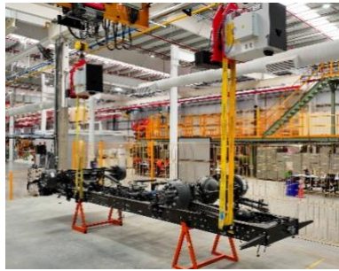
Zárte Industrial Center - Manufacturing