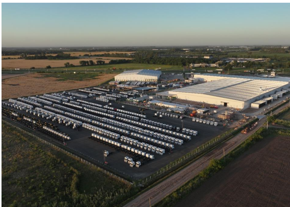
Zárate Industrial Center