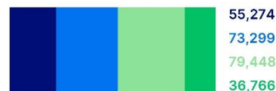
Kilométrage moyen falsifié, km