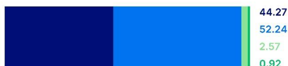
Part des rapports totaux