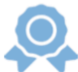
IMAGE DE L'ENTREPRISE : MONTRER SON ADHÉSION AUX VALEURS VÉHICULÉES PAR L'AUTOPARTAGE

L'autopartage permet de diminuer l'empreinte environnementale de l'entreprise par l'optimisation du nombre de véhicules mis à disposition, ou via la mise en place de véhicules propres. A ce titre, nous observons chez nos clients l'exploitation du véhicule électrique dans la majorité des projets de flottes partagées.