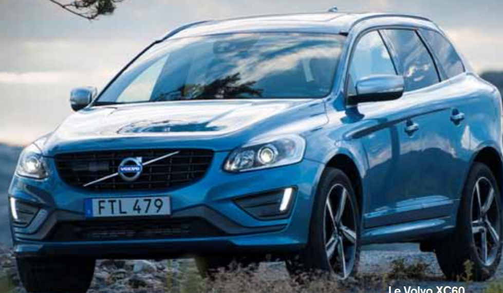
Le Volvo XC60, toujours best-seller de la marque en France avec une progression de 35 %