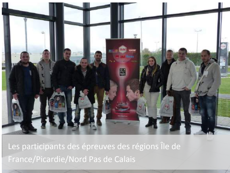
Les participants des épreuves des régions Île de France/Picardie/Nord Pas de Calais