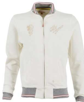
5) Sweatshirt en coton