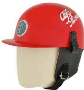
7) Casque Vintage