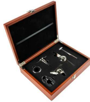
3) Coffret œnologie