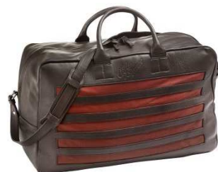
12) Sac en cuir et tissu