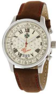
1) Montre Chrono

Voici une sélection de quelques références issues de cette collection exclusive :