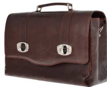
9) Sacoche en cuir Héritage