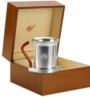
2) Tasse en aluminium