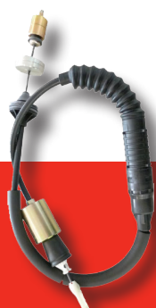
Câble de débrayage