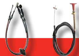
Câble de boîte à vitesse et autres