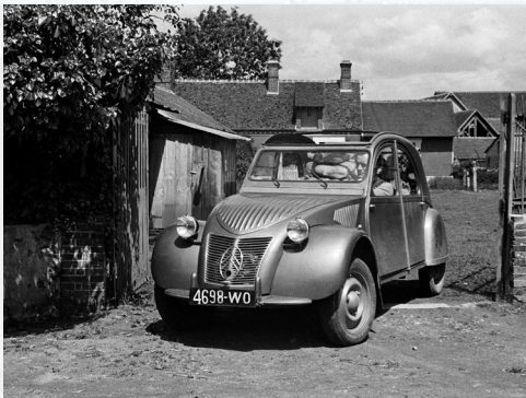
Citroën 2CV

Déjà 70 années d'existence pour la Honda Motor Company qui, à ses débuts, était une petite marque japonaise de motos. Aujourd'hui, Honda est sur la première marche du podium des producteurs de moteurs. Retour sur son histoire. Dans un contexte post-guerre mondiale, où les Japonais ont interdiction de produire des voitures particulières, Soichiro Honda se lance le 24 septembre 1948 dans la fabrication de deux-roues à moteur. La marque rencontre rapidement un large succès notamment avec la première motocyclette de la série Dream. Porté par la réussite du département moto, Honda s'intéresse dès 1963 au marché de l'automobile avec le lancement de la S500. Honda impose rapidement ses automobiles dans l'univers de la compétition, notamment en F1. Néanmoins, le succès ne viendra que 20 ans plus tard grâce à l'association du constructeur avec McLaren et Williams.