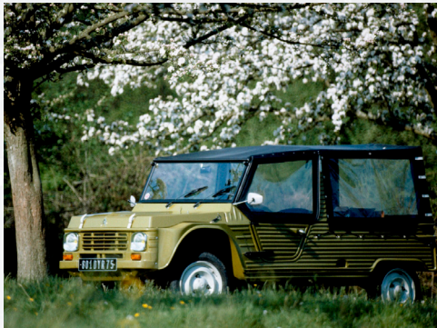
Citroën Dyane 6 Méhari

2018 est aussi une année anniversaire pour la marque aux chevrons ! La 2CV, voiture emblématique française, célèbre ses 70 ans, tandis que la jeune Méhari fête son 50ème anniversaire.