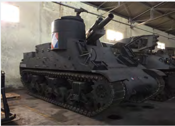
M7 Priest Tank Collection Musée des Blindés

Cette année, l'équipe du Musée des Blindés de Saumur présentera en démonstration dynamique, en extérieur devant le pavillon 1, le canon automoteur M7 Priest. Ce blindé fut conçu pour l'artillerie en 1941 et servira jusqu'à la fin de la guerre. La casemate recevait un gros obusier de 105 mm qui en faisait une arme redoutable. Ce canon automoteur joua un rôle décisif dans la victoire sur les forces allemandes dans la bataille du désert « El Alamein ». Ce blindé fut baptisé « Priest » par les soldats de l'armée Britannique car il est équipé d'une petite tourelle ouverte qui ressemble étrangement à une chaire utilisée par les prêtres pour s'adresser à ses paroissiens. Le moteur de cette pièce d'artillerie est tout aussi impressionnant, un superbe V8 Ford digne d'une voiture de compétition, entièrement en aluminium, deux culasses à 4 arbres à cames en tête, 4 soupapes par cylindre. Les 18 litres de cylindrée développaient 500 CV et engloutissaient ses 500 litres d'essence au 100 km.