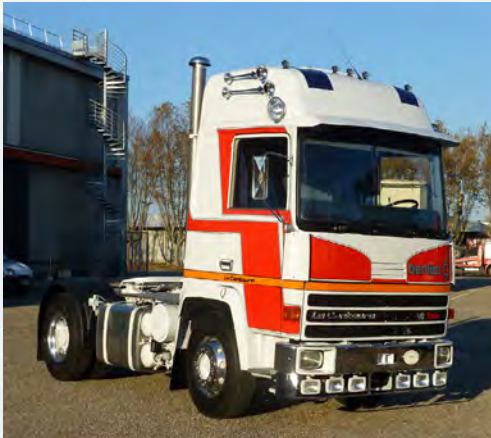
Berliet TR 350 «Le Centaure» - 1978