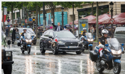
DS 7 CROSSABCK