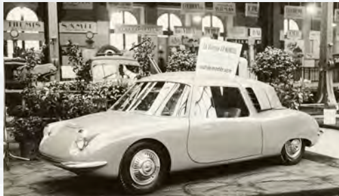
JPW 01 Présentation au salon de l'Automobile en 1948