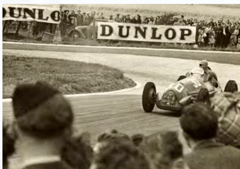
Gordini Monoplace Type 15

Bien qu'il soit de plus en plus occupé par la conception automobile, Wimille n'abandonna pas la compétition et poursuivi sa carrière au sein de l'écurie Alfa Roméo. Il remporta 8 compétitions dont 3 victoires successives au volant de la puissante 308 : la Coupe de la Résistance, le Grand Prix du Roussillon et le Grand Prix Burgundy. La rencontre entre Jean Pierre Wimille et Gordini est l'une des plus belles histoires de la compétition automobile. Les modèles Gordini, bien que moins impressionnants que les Bugatti et les Alfa Roméo avec lesquels le pilote avait l'habitude de concourir, se démarquent rapidement grâce à son talent. Avec 5 victoires au compteur en moins de 2 ans, le binôme Gordini/Wimille s'impose rapidement dans le milieu du sport automobile.