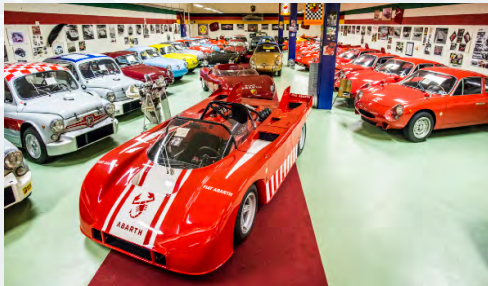
La Collection Engelbert Möll

Relancée il y a dix ans, la marque italienne au Scorpion a damné le pion aux plus grandes marques au cours des Trente glorieuses. Cette aventure haute en couleur sera explorée, le temps du Salon Rétromobile, avec vingt-deux modèles extraits de la magnifique collection suisse d'Engelbert Möll.