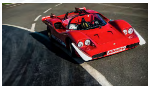
Fiat-Abarth 2000 Sport SE10 4-fari 1968