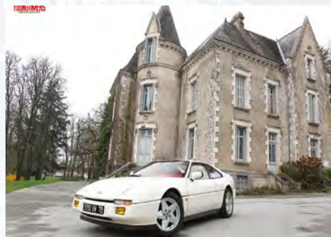
MVS Venturi

Le bien nommé Avantime (« avant l'heure » en français), né dix ans trop tôt, n'a jamais rencontré le succès escompté. Dans l'esprit des concepteurs, il s'agissait en effet de capter la clientèle aisée des grands monospaces, appréciant la position de conduite surélevée et l'habitacle inondé de lumière, mais finissant généralement par céder aux charmes d'un statutaire coupé made in Germany, une fois les enfants émancipés... Ce « coupéspace » accouché par Renault (et Matra) à l'aube des années 2000 témoigne à lui seul de l'esprit d'innovation et de singularité des constructeurs français : carrosserie SMC (Sheet Moulding Compound), portes à double cinématique, structure et brancards en profilés d'aluminium, etc.