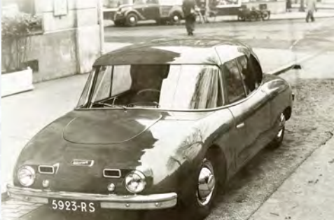
Wimille GT dans la rue

vers l'extérieur du virage et la course s'achève de manière tragique pour son pilote. La disparition de Wimille sera un véritable choc !