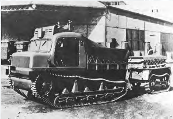
Tracteur ravitaillement 36 R

Ce petit tracteur Renault était conçu pour assurer le ravitaillement en carburant et en munitions des chars au combat. Le plateau était chargé de 800 kg d'obus et de cartouches. Sa cabine, provenant d'une camionnette civile, lui donnait une allure très moderne. Ce tracteur chenillé tirait une remorque de 600 kg de charge qui comprenait une citerne d'essence de 450 litres, des bidons d'huile et d'eau. Le véhicule est présenté aux autorités militaires en janvier 1938. Il existe encore 8 exemplaires sur les 260 produits.