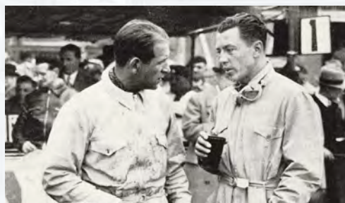
Jean-Pierre Wimille