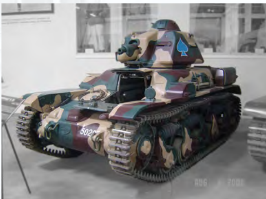
Renault R35 Collection Musée des Blindés

Au début des années 30, le char Renault FT de 1917 équipait encore majoritairement l'armée française. Le temps était venu de concevoir un char plus puissant. Le cahier des charges était précis : 2 hommes à bord, un poids de minimum 8 tonnes, un moteur qui permettait d'évoluer à 20 km/h quelle que soit l'inclinaison, une autonomie de 8h de fonctionnement et comme armement un canon semi-automatique de 37 jumelé à une mitrailleuse de 7,5 mm. Renault produisit 1 540 exemplaires du R35 entre 1935 et 1940. Ce char possédait un blindage suffisant pour résister aux canons de petit calibre. L'équipage était composé, à l'avant, d'un pilote et, en tourelle, d'un chef de char-tireur simplement assis sur une sangle en cuir. Ce char équipa également l'armée polonaise, roumaine, yougoslave et turque. Ce char d'infanterie construit en 1540 unités était de conception très robuste. Il fut utilisé jusqu'aux années 50 par d'autres pays comme la Syrie et l'Israël.