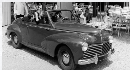
Peugeot 203 cabriolet