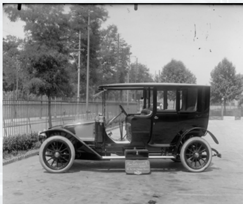
Coupé chauffeur Renault, Carrosserie Labourdette, photographie, plaque de verre