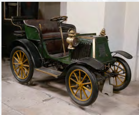
Renault 1901 type D début 20e siècle