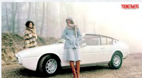
Matra Bagheera «Courrèges»

Apparue en 1976, la version Prestige de la CX possède tous les attributs d'une voiture de haute lignée. Un empattement allongé de 25 cm – celui du break –, le toit vinyle typique des hauts de gamme des années 1970, de l'inox et du chrome en abondance, des enjoliveurs spécifiques. Il faut cependant pénétrer à bord pour prendre véritablement la mesure du travail accompli par la marque aux chevrons. Cuir capitonné à tous les étages, moquette pure laine, ciel de toit en Alcantara, pare-soleil et allume-cigares individuels, repose-pieds pour se détendre les voûtes plantaires, dragonnes pour s'extraire de la voiture, vitres électriques pour tout le monde et climatisation : ça, c'est palace !