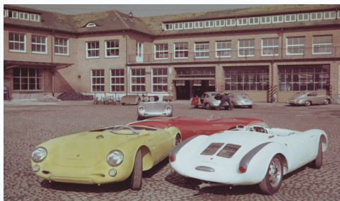
Devant l'usine Porsche en 1955

La Dyane 6 Méhari, ou plus communément appelée « la Méhari », voit le jour au milieu de la crise de mai 1968. Ce véhicule de loisir conçu par Roland de la Poype, un industriel de la plasturgie, attire à nouveau l'attention du grand public et étonne par son originalité. Dotée d'une carrosserie de style pick-up, elle sera proposée au lancement en trois teintes : ocre sable, rouge vif et vert forêt. Sa production sera reconduite jusqu'en 1987 à hauteur de 150 000 unités.