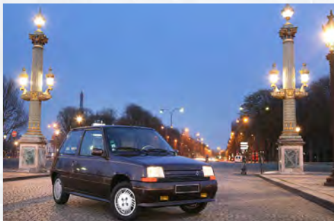
Renault Supercinq Baccara