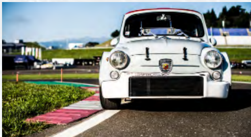
Fiat Abarth 1000 TCR (Radiale) 1968