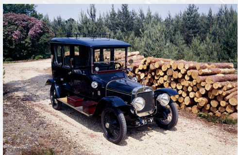
Argyll 25hp 1913

La Bentley 4,5 litres Supercharged ou Bentley Blower pour les connaisseurs est sans doute la plus renommée de cette exposition. Conçue en 1930 par le pilote automobile Sir Henry Birkin, le véhicule a été produit en seulement 50 exemplaires, ce qui en fait un modèle exceptionnel ! Avec 5 victoires au compteur aux 24H du Mans entre 1924 et 1930, cette voiture a permis aux Bentley boys de revenir dans la course face à une concurrence aux moteurs plus puissants. Lors d'une démonstration devant le Pavillon 1 du Salon, les visiteurs auront le plaisir de revivre les heures glorieuses de la Bentley Blower qui fera vrombir son moteur aux côtés de la Morgan Racer Atomic de 1933.