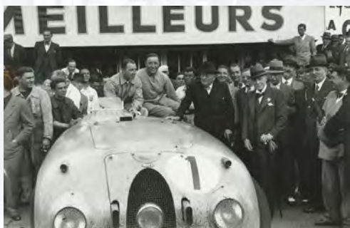
Tank Bugatti 57 G