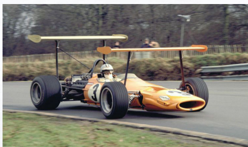
McLaren M7A Cosworth