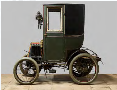
Petit coupé de ville Renault, type C Moteur de Dion-Bouton monocylindrique de 3 CV, allumage par magnéto.