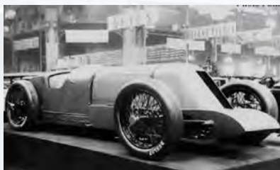
Voisin des records de 1927

Passage incontournable entre les Pavillons 1 & 2, la passerelle du Salon Rétromobile réserve chaque année à ses visiteurs un voyage dans le milieu de la course automobile. Après le succès, en 2017, de l'exposition « Groupe B, 30 ans déjà ! » le Salon Rétromobile et Les Grandes Heures Automobiles s'associent de nouveau pour une exposition dédiée aux records de l'Autodrome de Linas-Montlhéry, ce circuit mythique tout près de Paris.