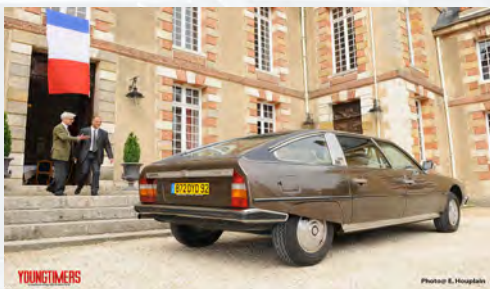
Citroën CX Prestige