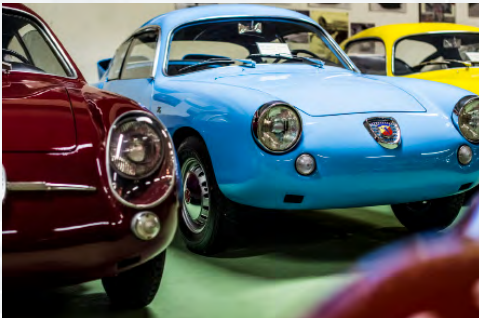
Fiat-Abarth 750 Bialbero Record Monza 1959