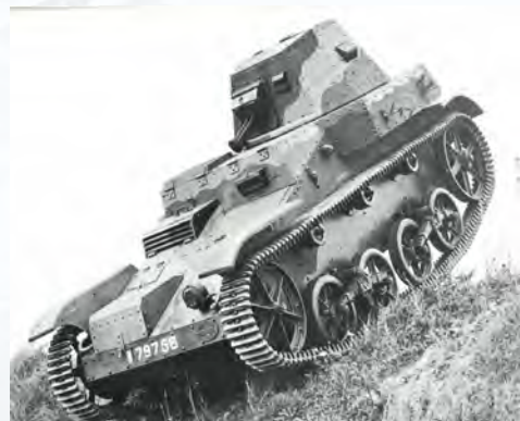
Automitrailleuse Renault AMR Collection Musée des Blindés

En 1931, le projet d'une automitrailleuse blindée sur chenilles, équipée d'une tourelle, fut étudié chez Renault pour les régiments de cavalerie. Grâce au moteur 8 cylindres qui était monté sur les Renault Reinastella, l'AMR pouvait atteindre la vitesse de 50 km/h et se révéla bien adapté à son rôle de reconnaissance, avec d'excellentes qualités tout-terrain. Ce blindé léger fut utilisé jusqu'en 1940. Le modèle présenté est le seul existant sur les 123 construits.