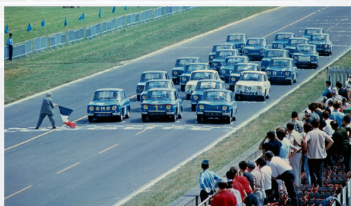
Renault 8 Gordini Coupe Gordini 1965

L'année 2018 marque une année riche en anniversaires. Comme à chaque édition du Salon, de nombreux constructeurs donnent rendez-vous aux visiteurs pour une rétrospective de leurs plus grands modèles. Le thème de cette année ? Les célébrations de nombreuses années au service des amateurs et passionnés d'automobiles.