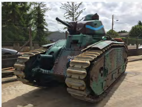
Renault B1 bis Collection Musée des Blindés

Avec ses chenilles enveloppantes, son canon de 75 déporté sur la gauche en caisse et un canon de 47 mm en tourelle, ce char de 32 tonnes était très impressionnant. Le puissant moteur Renault 6 cylindres de 307 CV était un dérivé d'un moteur d'avion. La direction du char ainsi que la visée du canon de 75 étaient assurés par un système révolutionnaire entièrement hydraulique du type « Naëder ». A l'époque, cette technique était très moderne. Durant les combats, le B1 Bis était redouté des blindés allemands. Il était puissamment armé et son blindage était si épais que les obus ennemis n'arrivaient pas à le perforer. Mais ce monstre demandait un entretien rigoureux, son pilotage nécessitait une sérieuse formation et il était très gourmand en carburant : le B1 Bis engloutissait ses 330 litres aux 100 km. Sur les 400 chars B1 et B1 Bis construits, il en reste 11 dont certains en épave. Le modèle présenté est le seul en état de fonctionner.