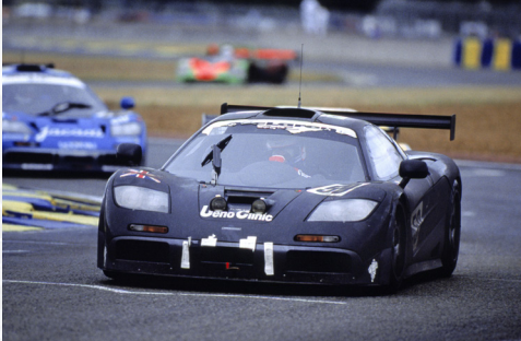
McLaren F1 GTR 1ère au Mans 1995

de celle de l'ingénieur, John Barnard. Ce dernier conçoit la première F1 en fibre de carbone, la MP4/1. Avec des coureurs tels que Niki Lauda, Alain Prost et Ayrton Senna, associé à de puissantes F1 comme la monoplace MP4-4, l'écurie est inarrêtable. McLaren ne décroche pas moins de quinze victoires sur les seize courses que compte le championnat, en réalisant dix doublés. A cette époque, Gordon Murray, le nouveau directeur technique de l'écurie et Ron Dennis ont pour ambition de produire la supercar ultime. Ce rêve se concrétise avec l'arrivée d'une GT à trois places frontales propulsées par un V12 BMW de 6 litres. C'est d'ailleurs la version sportive de ce modèle qui remporte en 1995 la très prisée course des 24 Heures du Mans.