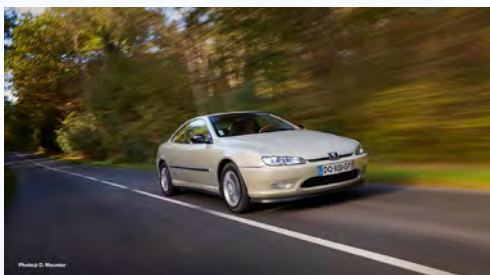
Peugeot 406 Coupé

La Bagheera débute sa carrière le 14 avril 1973 devant les journalistes au bord du lac d'Annecy. Avec elle, Matra recycle les bonnes idées de la 530 : châssis-coque en acier, caisse en polyester armé et moteur central arrière, cette fois positionné transversalement. Seul point de discordance entre Chrysler-Simca et Philippe Guédon, le patron de Matra Automobiles : le nombre de places à bord. Le premier en souhaite quatre, le second deux... Compromis fut finalement trouvé avec les trois fauteuils de front ! La série limitée « Courrèges » apparaît en septembre 1974 et se singularise par sa teinte, son garnissage intérieur blanc et son sigle « AC » (pour André Courrèges) sur la porte conducteur.