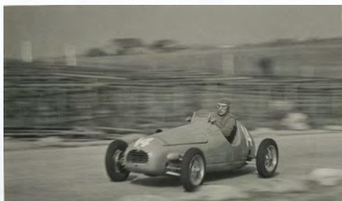
Alfa Roméo 308 Monoplace

Reconnu dans le monde automobile pour son coup de volant exceptionnel, Jean Pierre Wimille remportera 22 compétitions internationales au cours de sa carrière dont certaines parmi les plus mythiques au monde comme les 24H du Mans, la Coupe de Paris ou encore le Grand prix de l'ACF à Montlhéry.