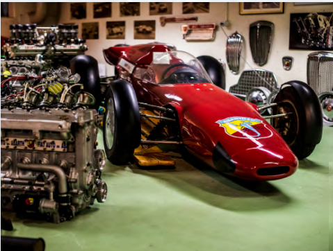
Fiat-Abarth 2000 Monoposto World Record, 1966

Le salon de Turin, cette même année sert de rampe de lancement à la première véritable Abarth : la berlinette Tipo 204 A, tandis que le grand champion Tazio Nuvolari vante les mérites de la jeune société dans les publicités. Bertone, Ghia, Boano, Michelotti, Pininfarina, Vignale, Zagato, les plus grands carrossiers italiens, habillent les Abarth. Si Fiat fournit le plus souvent les bases mécaniques, Abarth flirte avec Alfa Romeo, Simca et Renault.