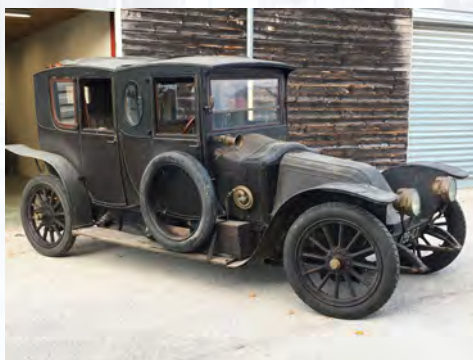
Double coupé limousine, Renault, type CC, 1911

La renommée de la marque s'étend, comme les usines de Billancourt tandis que la Compagnie des Fiacres parisiens commande 1500 taxis équipés du nouveau taximètre mécanique. Suite au décès de Marcel et à la maladie de Fernand, Renault frères est dissoute et la Société des Automobiles Renault est fondée le 1er octobre 1908. Louis est le seul maître à bord, les innovations se multiplient, la production progresse : en 1907, Renault représente 14 % de la production automobile française (179 voitures en 1900 ; 1179 à 5100 entre 1905 et 1910).