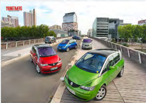
Renault Avantime