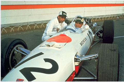
Honda RA273 S.Honda, Y.Nakamura (1966)