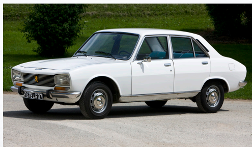
Peugeot 504

2018 marque l'anniversaire de deux grands succès commerciaux pour la marque au Lion : la 203 et la 504 ! Les deux automobiles souffleront respectivement leurs 70 et 50 bougies sur le Salon. Véritable symbole du renouveau de Peugeot après la Seconde guerre mondiale, la 203 a été présentée à la presse en marge du Salon de l'Auto en octobre 1947 et commercialisée un an plus tard. Cette berline robuste et fiable capable d'accueillir jusqu'à 6 personnes fera le succès de Peugeot jusqu'en 1960, après plus de 685 000 unités produites. L'année 1968 marque un nouveau tournant dans l'histoire des voitures Peugeot. La firme au Lion se réinvente avec la 504, un modèle signé par le carrossier italien Pininfarina. Peugeot prouve sa volonté de modernité en proposant en option la boîte automatique ZF. Commercialisée en version berline, coupé et dans une variante pickup exclusivement produite en Afrique, la 504 sera élue Voiture de l'Année en 1969. Véritable succès commercial jusqu'en 2005, près de 3 millions d'exemplaires de ce véhicule seront produits.