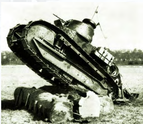
Renault FT 1917 Collection Musée des Blindés