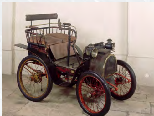
Voiturette Renault - Carrosserie du type Tilbury, moteur monocylindrique à ailettes de 1 3/4 CV fabriqué par la Firme de Dion-Bouton