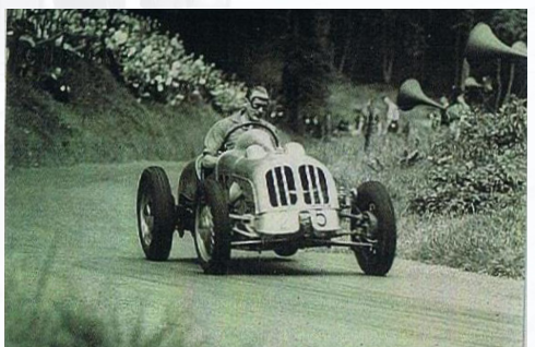
GN INSTONE MARTYR II en 1950