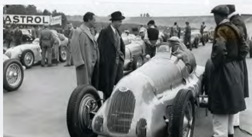
Bugatti monoplace type 5950B

Pour sa 43ème édition, le Salon Rétromobile dédie une exposition exclusive à un pilote au talent incontestable : Jean-Pierre Wimille. Vainqueur de nombreuses compétitions internationales dont certaines comptent parmi les plus mythiques au monde, le pilote a par la suite dédié sa carrière à la conception de la « voiture du futur ». Reconnu parmi les plus grands, le destin de Jean Pierre Wimille s'achève tragiquement en janvier 1949, en Argentine, lors de l'essai d'une Gordini. Retour sur son œuvre et son histoire.