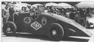
Yacco Petite Rosalie de 1933