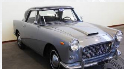
Lancia Appia Coupé