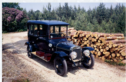
Argyll 25hp 1913

La Bentley 4,5 litres Supercharged ou Bentley Blower pour les connaisseurs est sans doute la plus renommée de cette exposition. Conçue en 1930 par le pilote automobile Sir Henry Birkin, le véhicule a été produit en seulement 50 exemplaires, ce qui en fait un modèle exceptionnel ! Avec 5 victoires au compteur aux 24H du Mans entre 1924 et 1930, cette voiture a permis aux Bentley boys de revenir dans la course face à une concurrence aux moteurs plus puissants. Lors d'une démonstration devant le Pavillon 1 du Salon, les visiteurs auront le plaisir de revivre les heures glorieuses de la Bentley Blower qui fera vrombir son moteur aux côtés de la Morgan Racer Atomic de 1933.