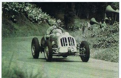
GN INSTONE MARTYR II en 1950

L'Ecosse n'est pas connue pour son industrie automobile florissante et pourtant le pays a aussi eu son lot de constructeurs. De 1899 à 1932, la société Argyll a conçu des véhicules de grande qualité. Inaugurée en 1906 par le baron John Douglas Scott Montagu, grand-père du créateur du National Motor Museum of Beaulieu, l'usine d'Argyll, située à Alexandria a produit des voitures jusqu'en 1932. Les visiteurs auront le plaisir de découvrir ce constructeur confidentiel avec la présentation de l'Argyll de 1913. Cette berline de voyages a été le premier véhicule à être équipé d'un système de freinage sur ses quatre roues.